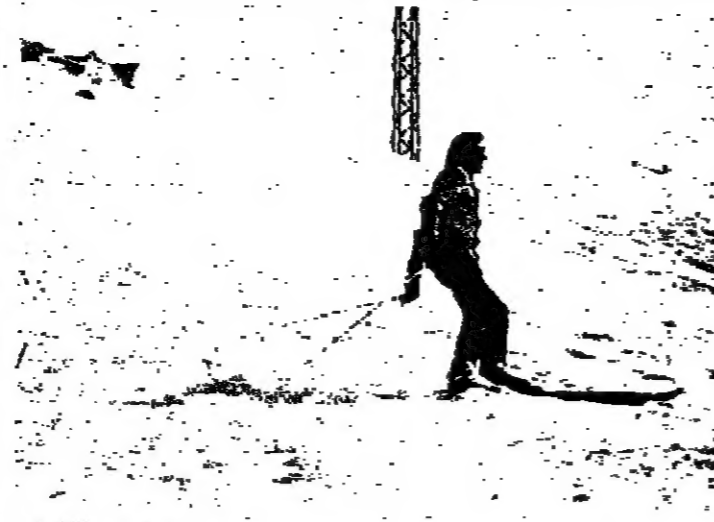
متزج يبارس هوايته

وزير المالية قبل اسبوع، فبعد موعدا قلائصهم، في اشارة الى استيلائهم، فمما صدقوا الى بيروت، واصف اولاد ان المزارعين ان يطبقوا بدم من اجل التبغ حترقهم بموتهم لبياتين. وقد امتنع المزارعون في الضفتين حتى الان عن تسليم محصولهم، والكتبات التي تنظر تبلغ خمسة اكر، كيلوغرام، لتعبر عرصة البحر والظفر، ونتيجة تكتلة الخلفاء امس، كتبت تحديد موعد جديد لثقة وزير المالية، هو العايدة عشرة من صباح امس، للذخا في بقية المناطق. مقابلة جديدة واوضح وفد المزارعين ان قائمهم زفرنا السيد ابراهيم الفقيه، اتصل